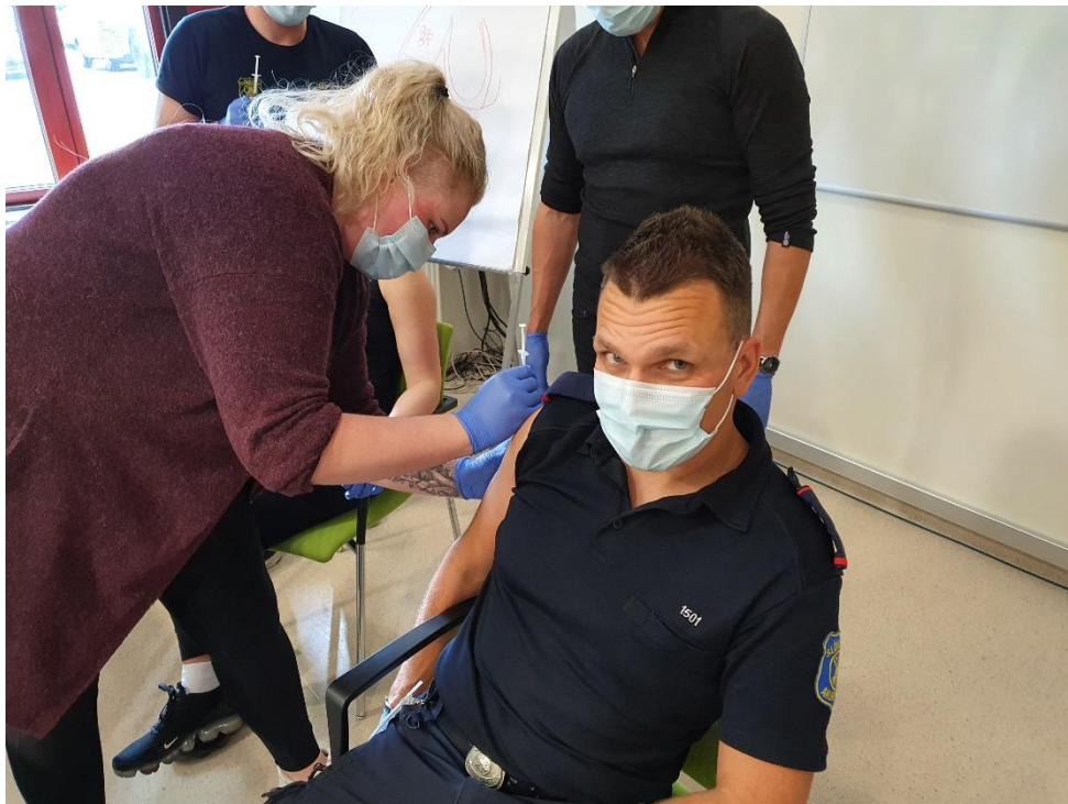
Nokkrir nemendur í framhaldsnámi í Lotu 4 á Akureyri.

Á árinu 2021 voru haldin 54 námskeið (voru 27 árið 2020) og var heildarfjöldi þátttakenda 560 (voru 238 árið 2020). Fjölgun var í öllum tegundum námskeiða milli ára en árið 2020 var óvenju rólegt ár að mestu vegna áhrifa Covid.